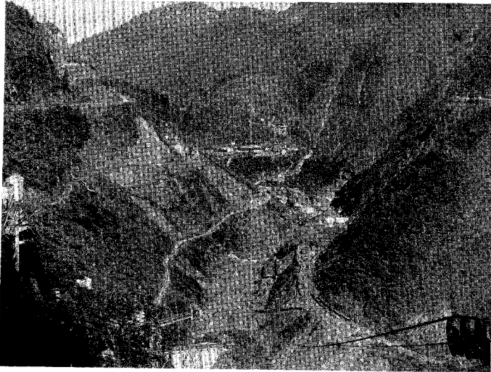
昭和 25 年当時のダム地点