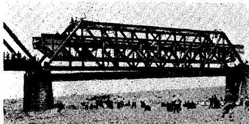
架替工事中の雄物川橋梁

このうち下路トラス9連は(1連は昭29架設)日本海の潮風による異状腐食はなほだしく、強度低下し、現在 40km/h の速度制限中で、今回これら老朽9連をKS-18の新桁に取替えることになったが、種々の諸条件から架設は縦取り吊下げ架替工法を採用した。工事は盛岡工務局が31年度下期に着工し32年度秋冬繁忙期前までに完成の予定で、目下トラスの組立架替工事施工中であり、その第1連目の架替が去る5月6日完了した。