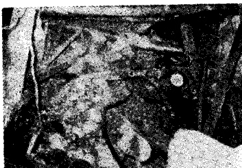
写真-3 導坑落盤状況