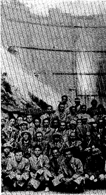
土木学会見学会におけ 記念撮影