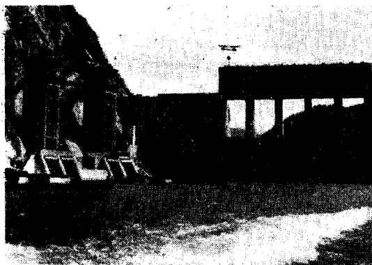
完成した佐久間ダム

佐久間ダムは着工後 11 カ月で径 10.5 m の付替トンネルに河流を付替え、深さ 25 m におよぶ河床砂利層の掘削が開始された。この掘削は、既応最大 7000 m 3 /sec に達する洪水の危険と戦いつつ、機械化工法により強力に進められ、1 日最大 8814 m 3 の実績が造られた。掘削完了後、昭和 30 年 1 月、コンクリートの打込みが開始され、1 日打込み量最大 5180 m 3 に達する早さで急速に進められていった。この間、延長 18 km の国鉄飯田線の付替も行われ、30 年 12 月、河流をダム内付替水路に切換え、標高 158.8 m までの第 1 次たん水が開始された。その後も、堤体上部および越流部ピアのコンクリートの打込み、ゲートの掘えつけ、副ダムのコンクリート打込み等が着々と進められ、この間 31 年 2 月に標高 182 m まで、3 月に標高 222.5 m まで、8 月初旬に標高 246.5 m までと、貯水位は順次上昇されて、去る 8 月 25 日、第 5 次竣工検査の完了をもつて全堤体は完成し、常時満水位標高 260 m までの最終的なたん水が、開始される運びとなった。着工以来 2 年 4 カ月、コンクリート打込み開始以来 1 年 7 カ月である。