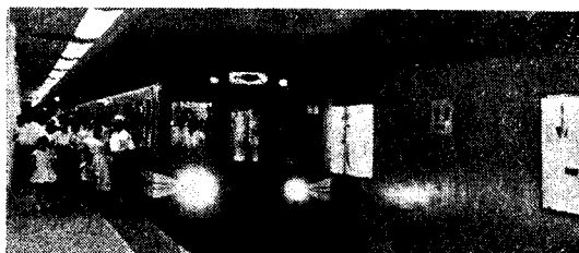
写真-3 完成した地下鉄東京駅ホーム

帝都中心部における地下鉄工事として、界隈各方面の注目を浴びていた帝都高速度交通営団施工にかかる、お茶の水-東京間 (2.2km) の工事は、予定以上に進捗し去る 7 月 19 日高松宮同妃両殿下御臨席の下に、盛大な発車式を挙行、翌 20 日より、一般営業開始をした。地下鉄の都心進出により丸の内線の利用者も約 2 倍に急増し 1 日の乗客は約 12,3 万人を数えるに至つた。なお引き続き東京・西銀座 (1.2km) を工事中である。