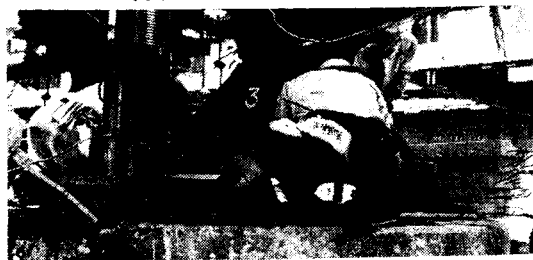
写真-1 上淀川橋梁貨物線扛上工事

国鉄上淀川橋梁は 27 年より上り線橋梁の改良工事中であるが、今般貨物線橋梁も建設省淀川改修計画にもとづいて、橋桁を 1.24~1.57m 扛上することとなった。扛上作業は 1 日 3 回列車間合を利用して、電動ポンプ (5HP) 駆動による分離式油圧ジャッキ (容量 100t, 衝程 25cm) を使用して施工する。従来この種の作業に使用している手動式ジャッキでは、扛上速度は 1cm/min 程度で、作業人員はジャッキ 1 台当り 2~3 人およびその交代要員が必要であつたが、この工事に使用するジャッキは扛上速度 3cm/min であり、4 台のジャッキが同時作動し、作業人員はジャッキ 1 台当り 2 人で十分である。ジャッキは構桁 1 連 (スパン 30m および 47m) について 4 台使用するの、ジャッキ 1 台当りの平均荷重はスパン 30m の桁の場合約 43t, スパン 47m の桁の場合約 67t であるが、実際に加わる荷重は桁のよじれや、レールによる拘束などのために、スパン 30m の桁の場合 28~63t, スパン 47m の桁の場合 64~94t と測定された。橋桁扛上は 1 回 17cm ずつ行い、コンクリートブロックで仮受けし、2 回扛上後、橋脚継足しコンクリートを施工する。工事期間は、31.3~31.10 で、このうち橋桁扛上は 31.7.14~31.9. 末の間に行う。総工事費は 78 000 000 円である。