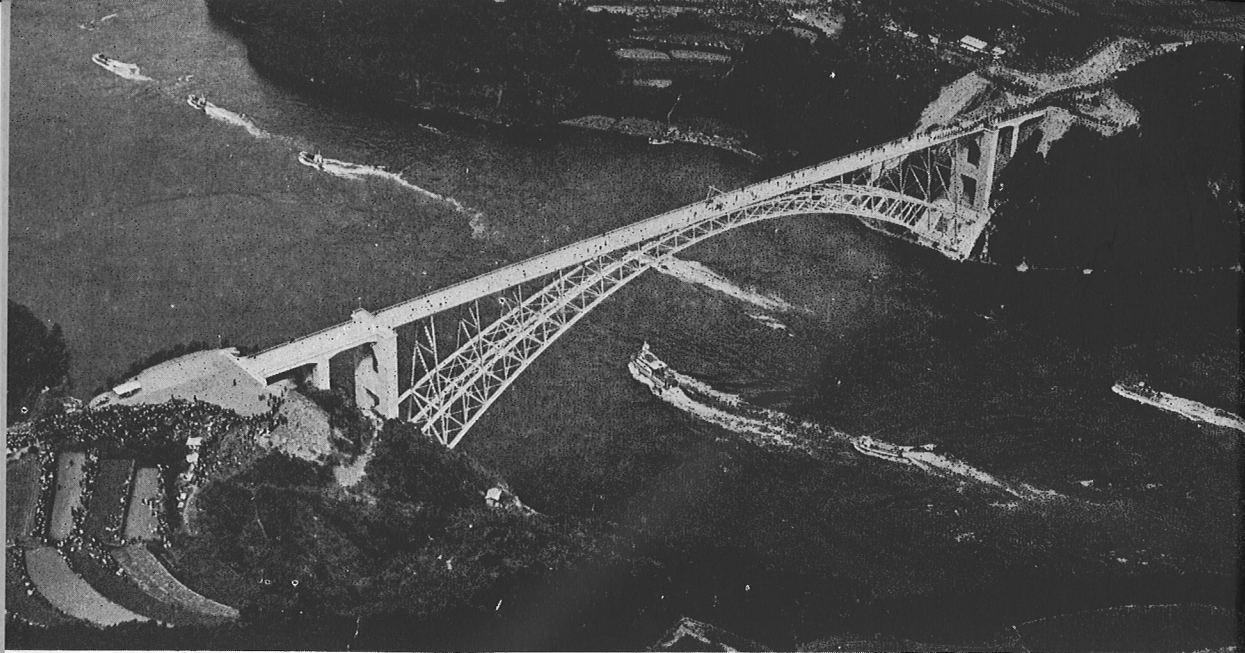
空中より見た西海橋の景観