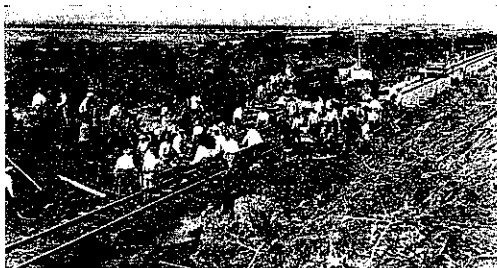
脱線車両取付後の復旧作業 (昭. 11. 10. 4)