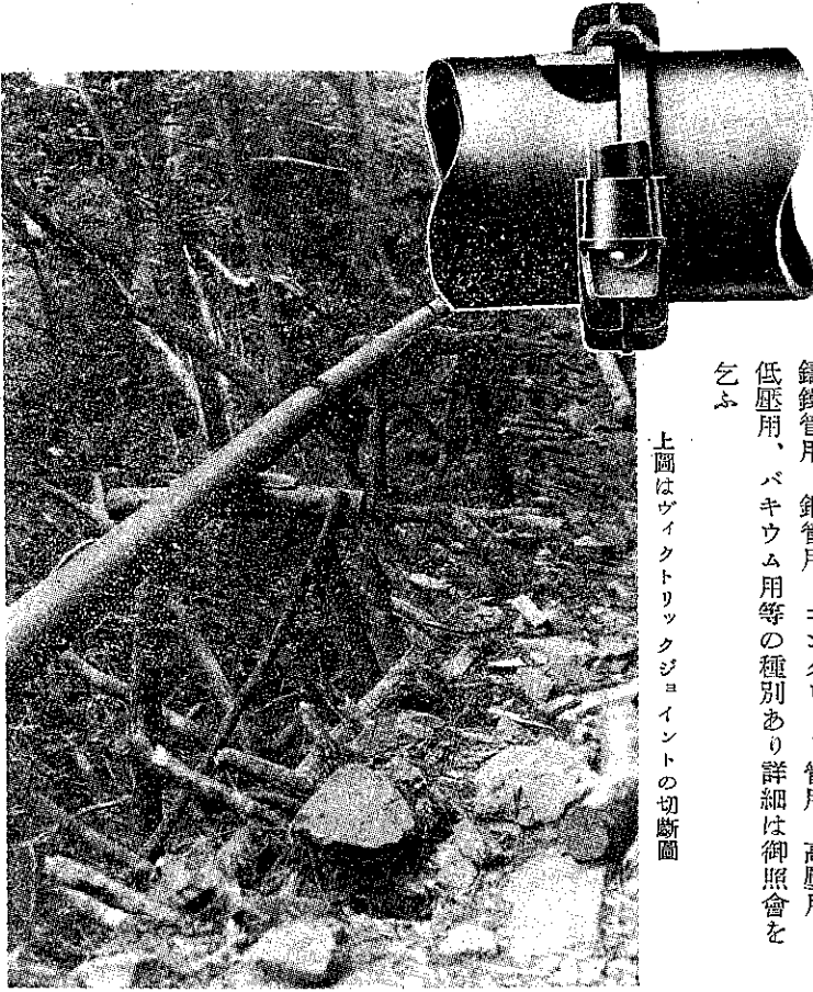
上圖はヴィクトリックジョイントの切斷圖

ヴィクトリックジョイントの接合、離脱は簡單にしてパイプライ ンの移動、延長を極めて迅速に行ひ得