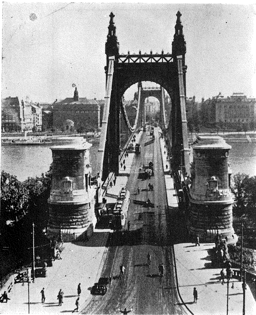
(3) Elizabeth Brücke ハンガリー

町は Budapest. 流れは Danube. 名橋三つである。 上流から順に云ふと、