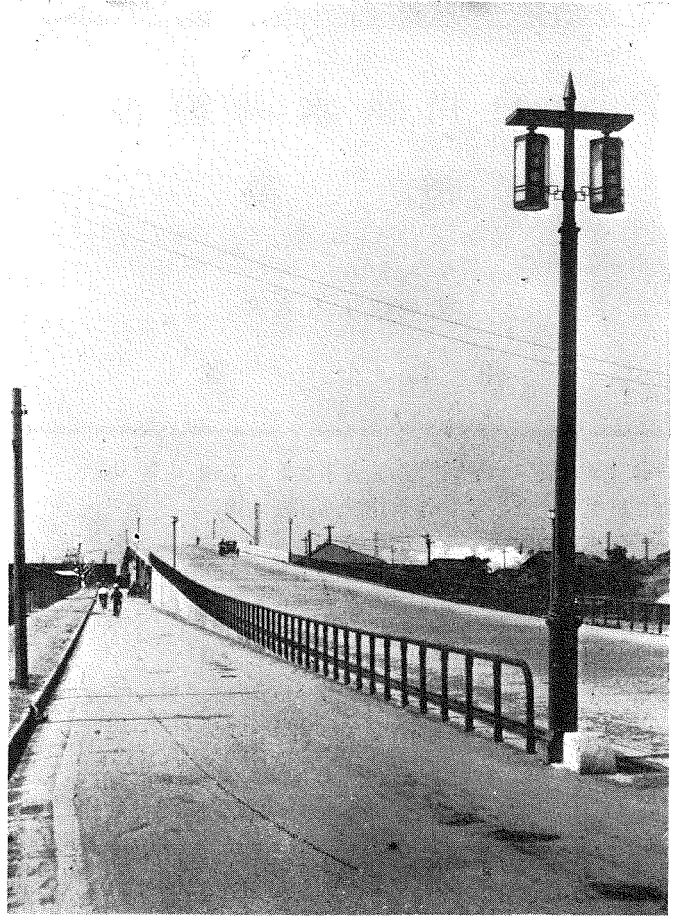
(3) 北方貨物線跨線橋 (中央高速車道高架、兩側緩速車道及歩道)

事業費總額7,549,533圓、都市計畫事業、失業救済事業、失業應急事業、幹線道路改良事業、時局匡救土木事業等として施行されたもので、工事は約200萬圓を費した十三大橋を最大とし、他に阪急神戸線跨線橋、北方貨物線跨線橋、新三國橋、阪急箕面線跨線橋等あり、鋪裝面積は228,301.60平方メートルに達してゐる。