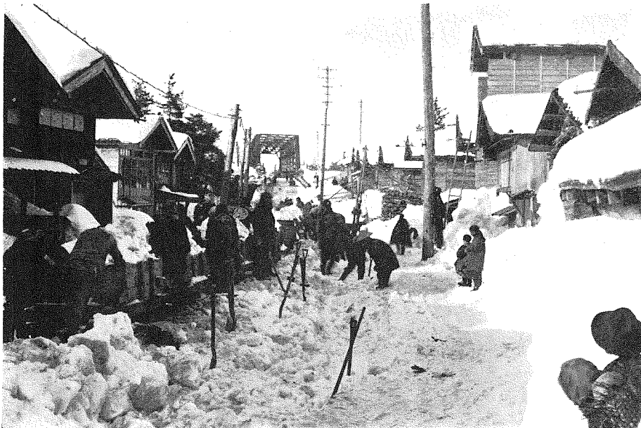
(4) 同上工事、中之島村地内に於ける排雪作業、同じく三月上旬の撮影である。

學には最も適當な個所であらうと思はれる。内務省の砂防堰堤工事の外に、昨年竣工した富山縣營の水力發電所が三ヶ所もある。何れも特色ある設計施工になつてゐるから、立山登山の途中で一度は必ず見