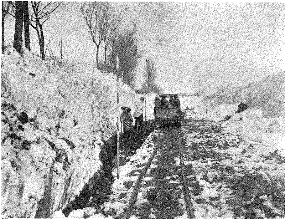
(3) 國道十號線改良工事、五百刈道路終點附近（新潟縣南蒲原郡中之島村地内）の三月上旬に於ける狀況。