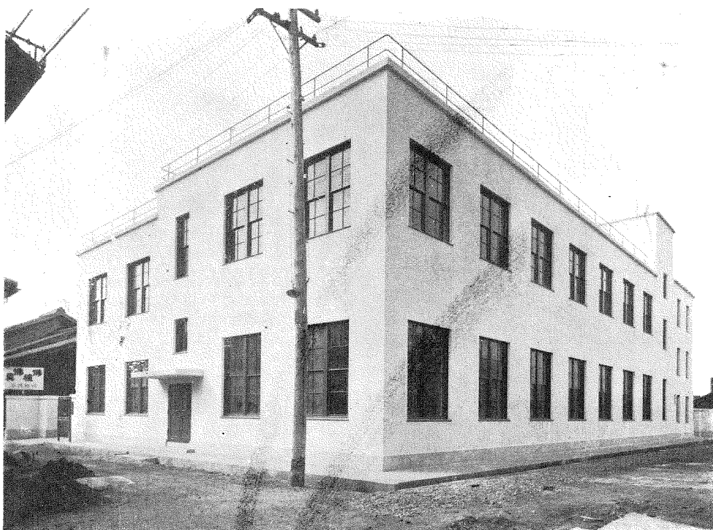
(1) 桑 名 電 話 局 正 面