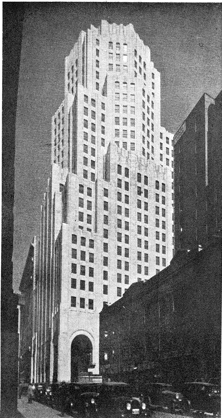
ニユーヨーク市 メトロポリタン 生命保険會社 全 景

D. Everett Waid and Harney Wilay Corbett Associated Architects.