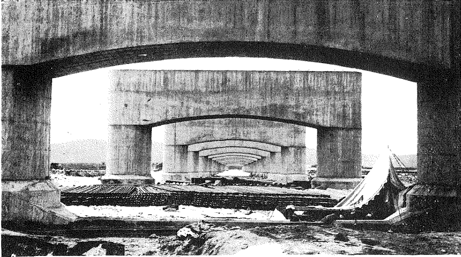
(4) 鐵桁架設中の漢江橋