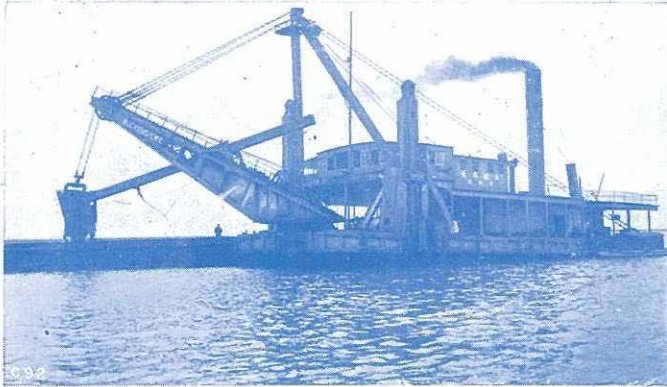
名古屋築港の スター四立方碼 半掻揚式浚渫船 五郎太丸