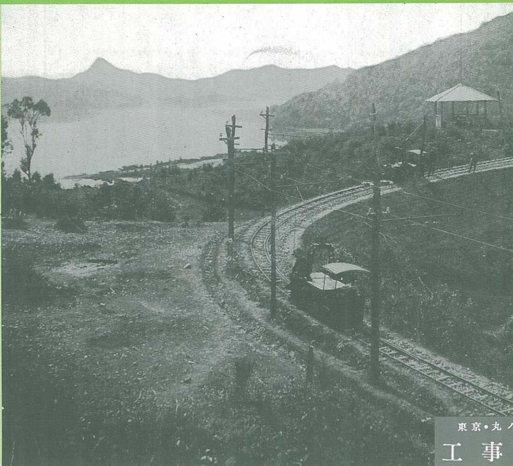
日月潭の遠望と工事用軌道(魚池越え)

大正十四年七月十八日 第三種郵便物認可 毎月一回發行 昭和六年三月二十六日 印刷 不 昭和六年四月一日發行 第七卷 第四號