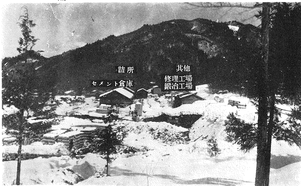
寫眞第六 側面より見たる建設中の設備及材料置場。