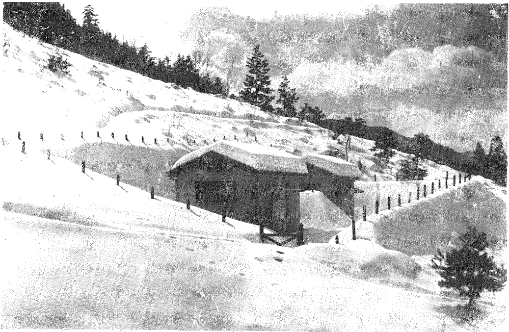
寫眞第八 火藥庫、隧道坑門口より約四百米の地點にあり。