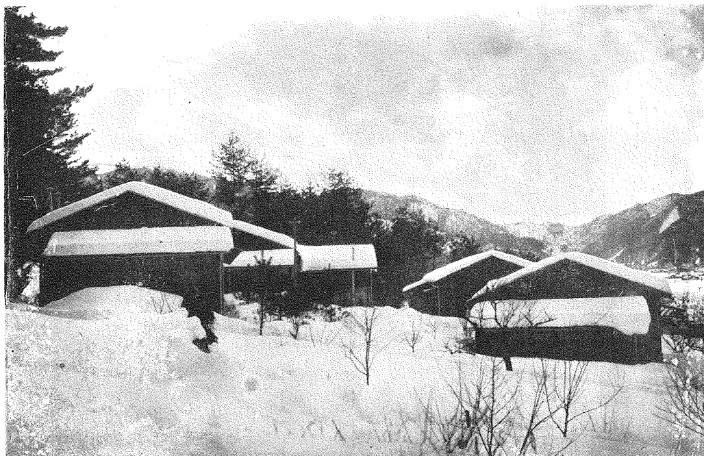
寫眞第五 人夫の住宅、現在建築済のものは人夫長屋は六戸建二棟人夫小屋は二十名收容しうるもの二棟。