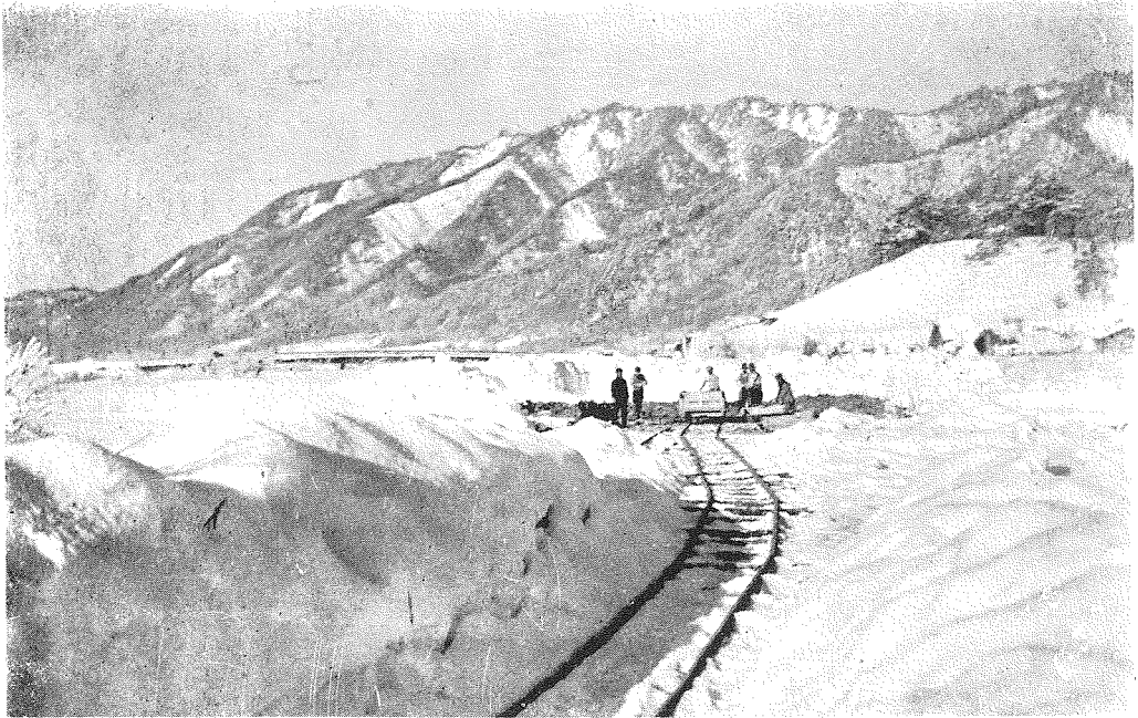
寫眞第七 砂利砂採集場、宮川(神通川上流)の河洲より積雪を排除して採集す邊に見ゆるは宮川に架せられたる道路橋。