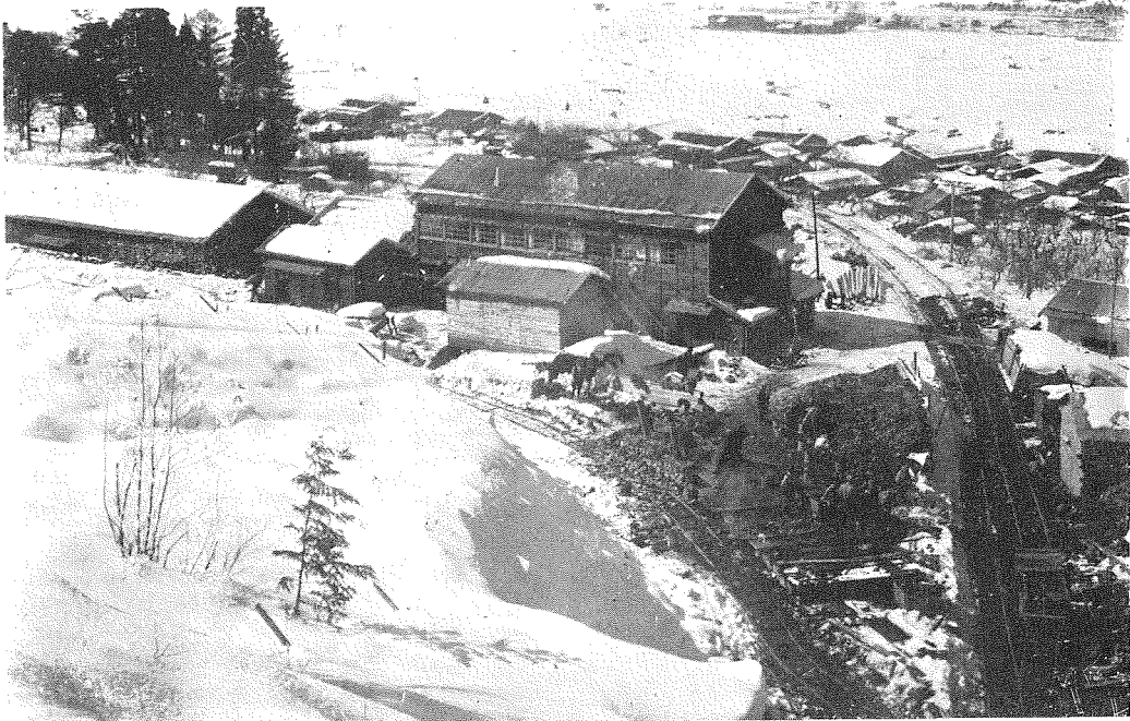
寫眞第四 隧道上部より見たる設備 詰所は二階建として階下は雜品倉庫とす遠景は宮村部落及び盆地。