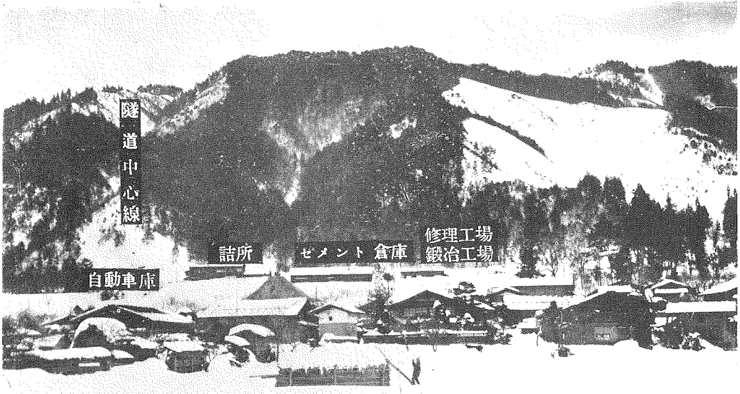
寫眞第一 宮隧道中心線、手前の家屋は隧道附近部落の民家。