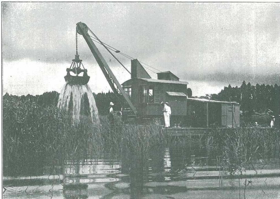
(茨城県三村耕地整理組合納)