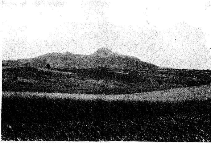
1、有珠岳、有珠停車場の背部に聳立する活火山、海拔2,395呎