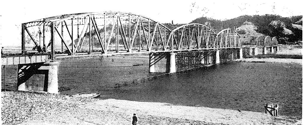
The Kasumibashi-Bridge, recently completed in the city of Okayam.