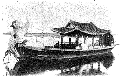
(8) Daidoko Gabou, Excursion Boat.

花一枝も立てないが、それが墓なのである日本でも天皇の陵墓は皆此の上の圓丘であるが、朝鮮のは小さいから、そして何の印もないから、山にデコボコがある位にしか見えない、之丈は實にアツサリしたものである。