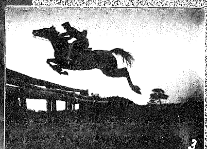
(1) 5月2日土野帝國學士院で授賞式舉行、前列右から土肥慶藏、中井猛之進、柴田雄次、加藤元一、村上武次郎、後列櫻井院長、三土文相、一木宮相、鳩山官長、加藤繁の諸氏 (2) 5月22日御渡歐の李王兩殿下 (3) 來夏國際オリンピックへ馬術を以て出場する吉田大尉の妙技 (4) 5月25日永代橋開通祝右から西久保市長、平塚府知事、堀切復興長官、武藤内務次官 (5) 5月26日横濱に入港せる加州大學野球團一行中の花形右から捕手ワイヤット、投手デヤコブソン、投手ネメテック (6) 5月25日多摩陵へ御參拜あらせられし聖上陛下が御召自動車にて赤坂離宮へ御歸還の光景 (7) 日本柔道研究のため來朝した英國貴族の令嬢リョードベーカー(22才)さんの稽古姿 (8) 5月28日北支出兵歸行の決意をなし赤除離宮へ御裁可を仰がんと參内する田中首相 (9) 5月27日海軍記念日に特に三笠艦上に於て東郷元帥と、記念撮影あらせられた聖上陛下 (10) 5月27日の海軍記念日に日比谷公園に於て行はれた軍艦旗掲揚式(旗は先帝陛下が陸奥進水式當時御座所に使用せられしもの)