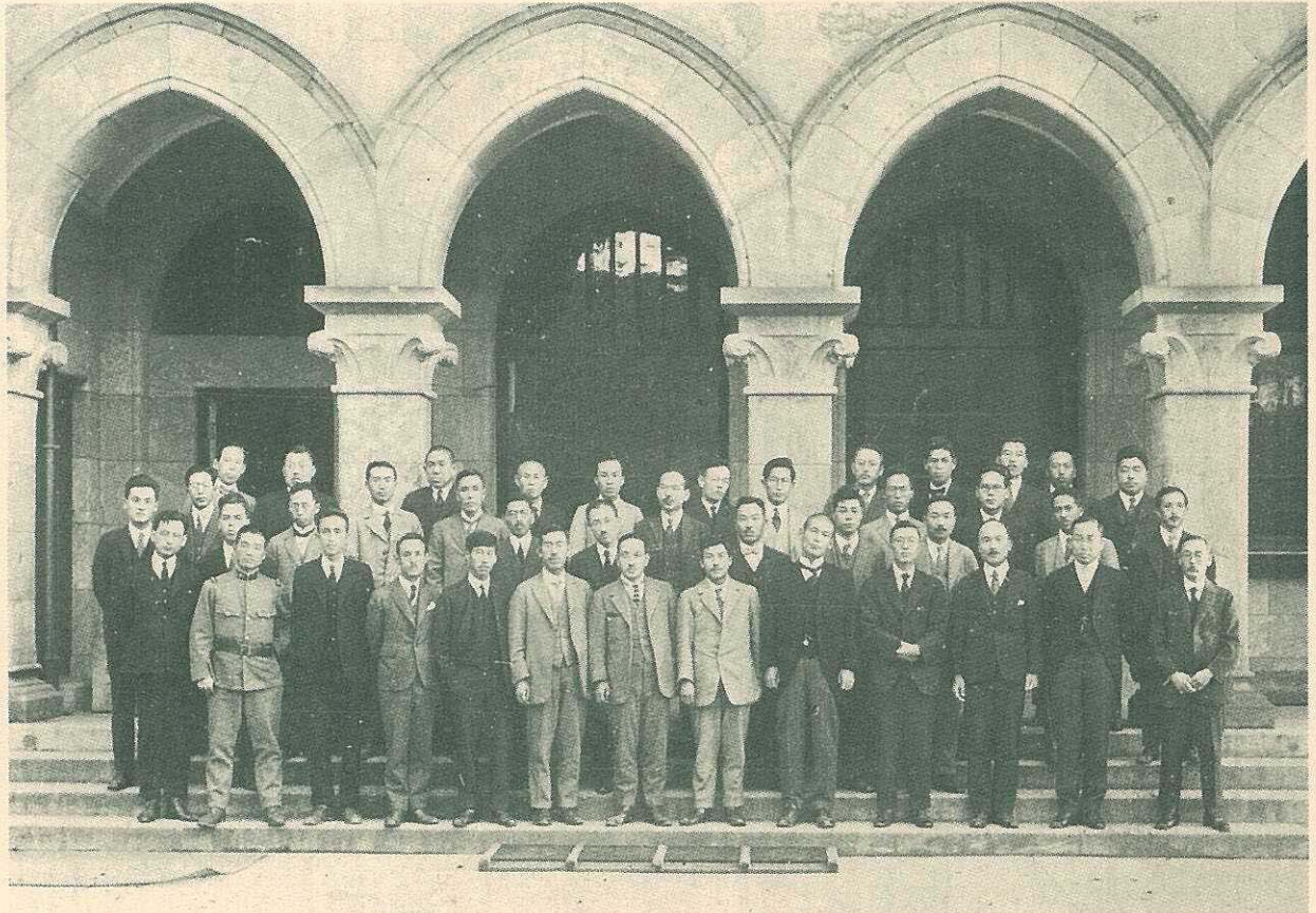
Taken at The Tokyo Imperial University, October 12th, 1926.

凝混土應壓強度試驗方法に關する協 議會に出席したる各大學、各試験所、 各民間の權威者達が會後の撮影