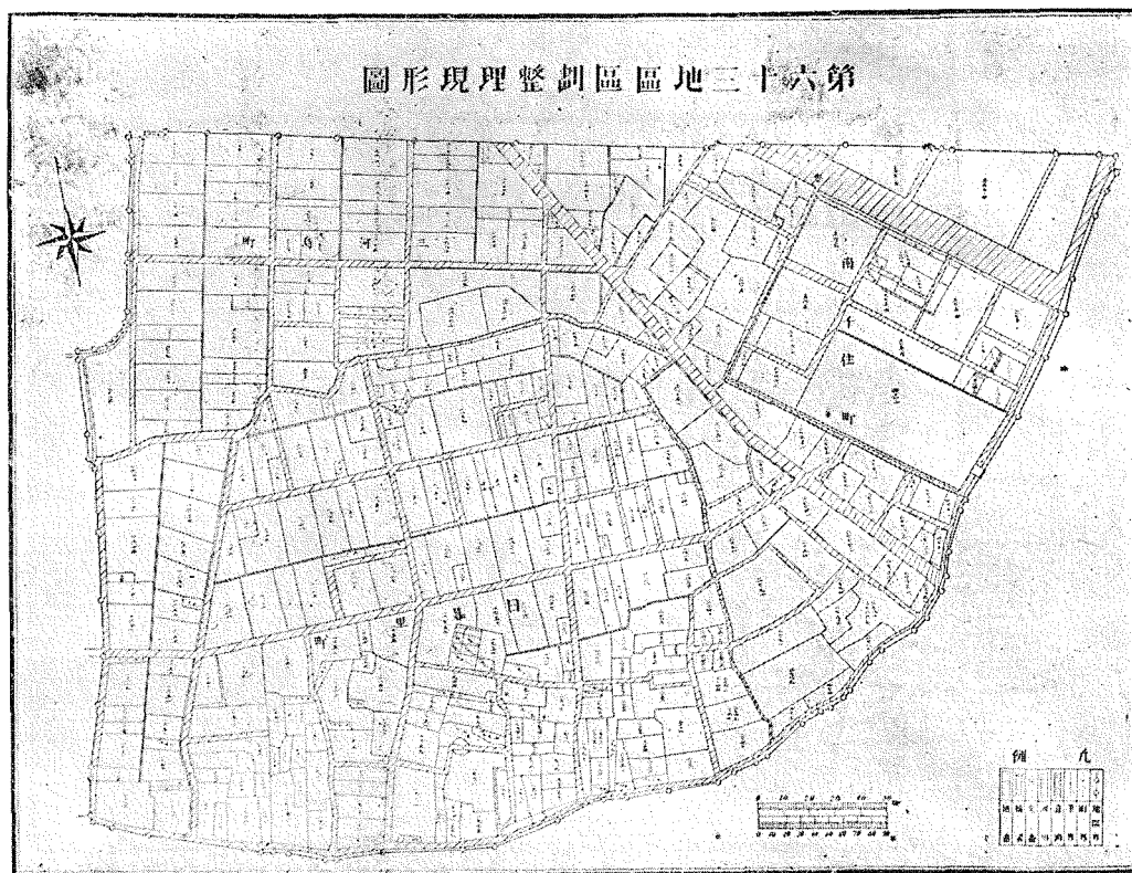
(1) 複雑せる舊街路(東京市東北隅日暮里町)

而かもこの立派な街區の建設が、震災の大災害を受け乍ら一向に進捗しない東京市の事業に比して約半歳にして出来上つた事は注目すべきである。