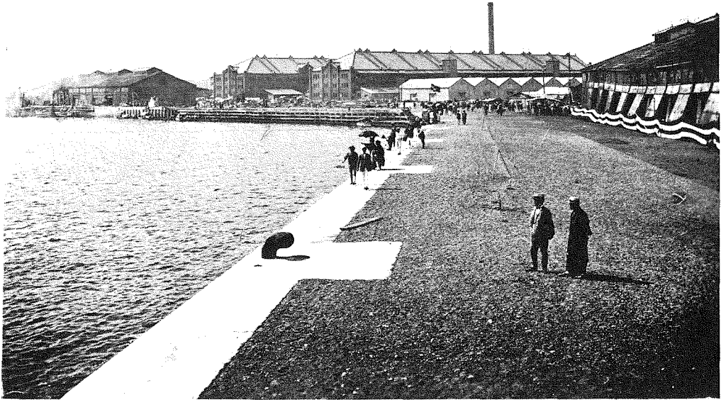
(26) 竣工せる岸壁 延長千百間