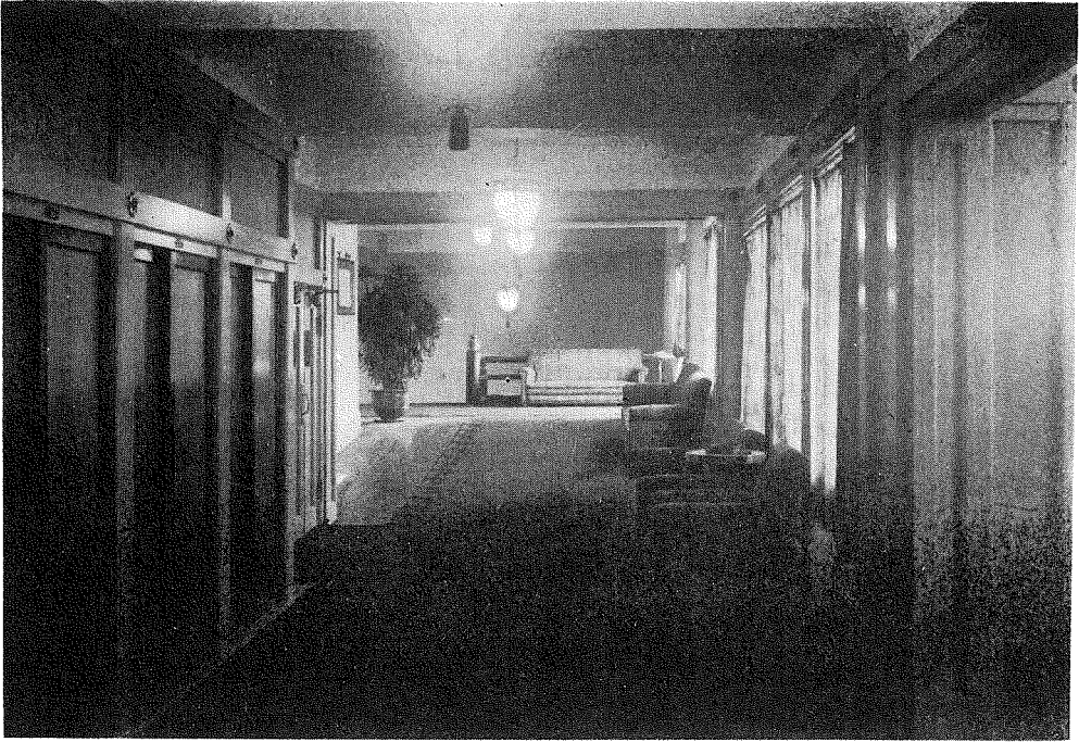
歌舞伎座、二階左右廊下