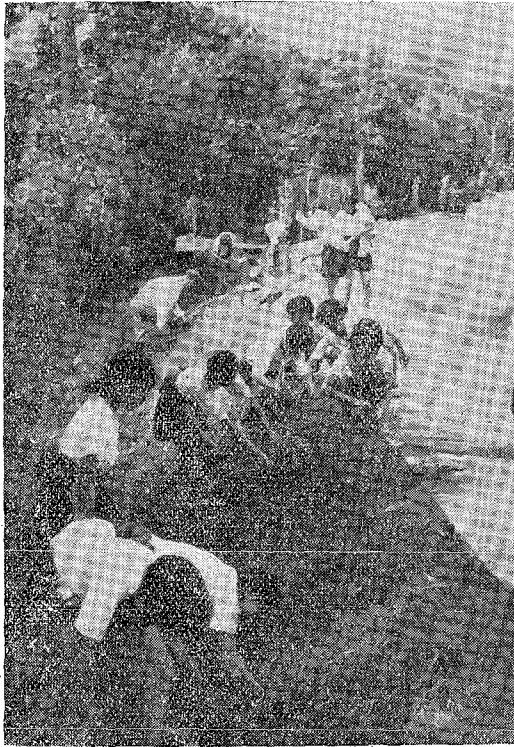
二宮小學の女生徒

に、彼等は道路愛護に習慣附けられてゐるのだ。かうした事情が、要求が、急速にそして一般的に小學兒童を道路愛