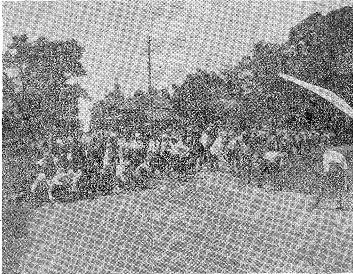
平三小學校（郡原市）の兒童の作業

道路愛護會は多くの會員の勞力を費して道路の維持保全上、重要な役割を演じてゐるのであるから、縣の優良團體表彰に際しては、表