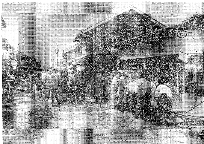
三日町静岡の流汗奉仕譜

本會 は同町 青年團 を以て 組織し 昭和十 二年一 月創立 せるも のにし て曩に 道路愛 護に關 する諭 告發布