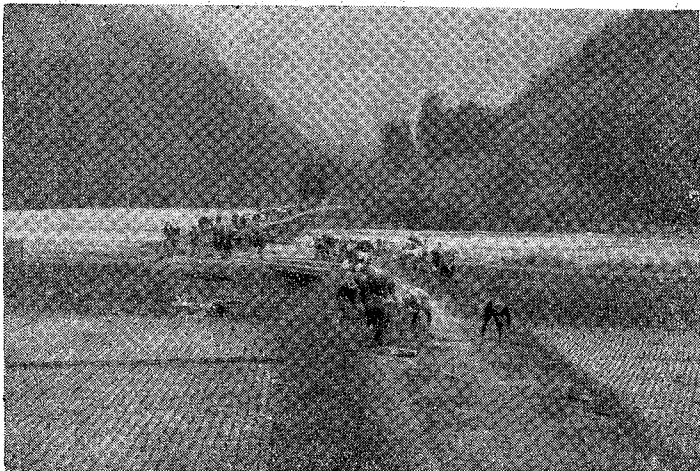
業作の國年青町取稻