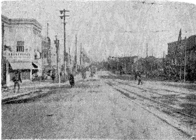
幹線第二號路線（江東橋通）鋪裝狀況