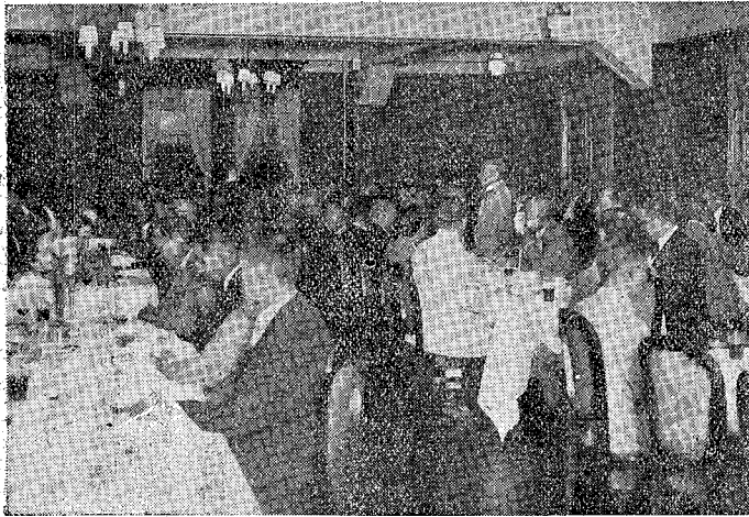
(一) 會待招官任主木土