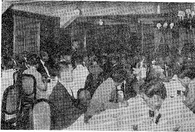
(二) 會待招官任主木土