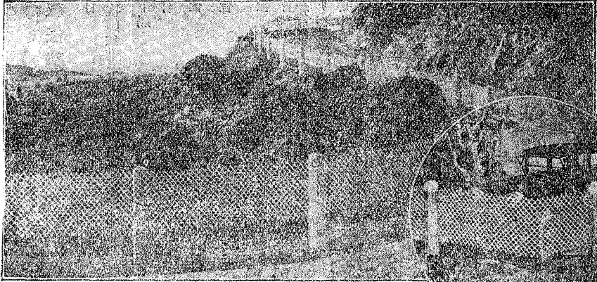
A Giant Elastic Net for Dangerous Curves, Embankments, Bridges and Culvert Approaches etc.,