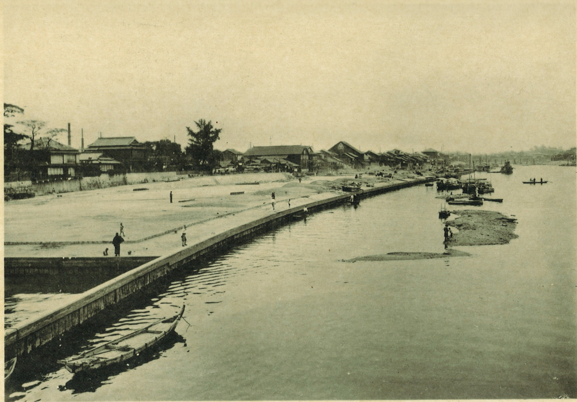
岡山港混凝土矢板護岸延長1.700米