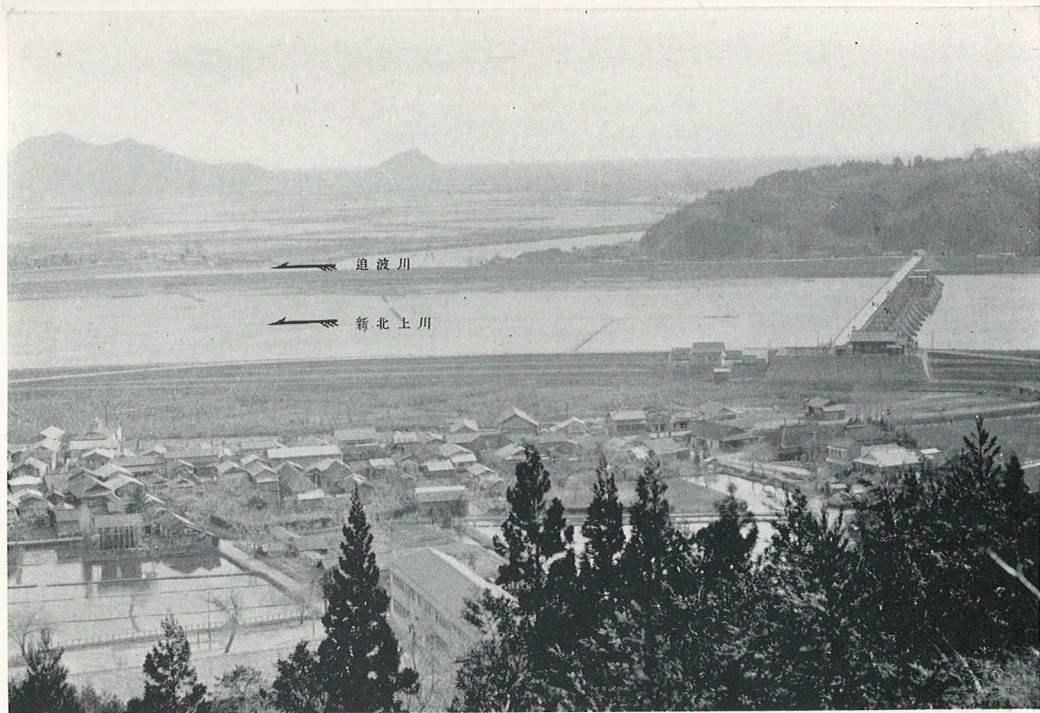
(3) 飯野川可動堰附近全景