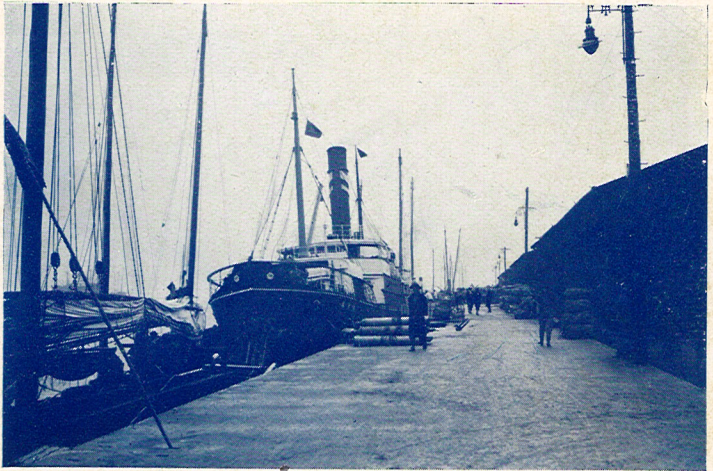
東 工 區 岸 壁