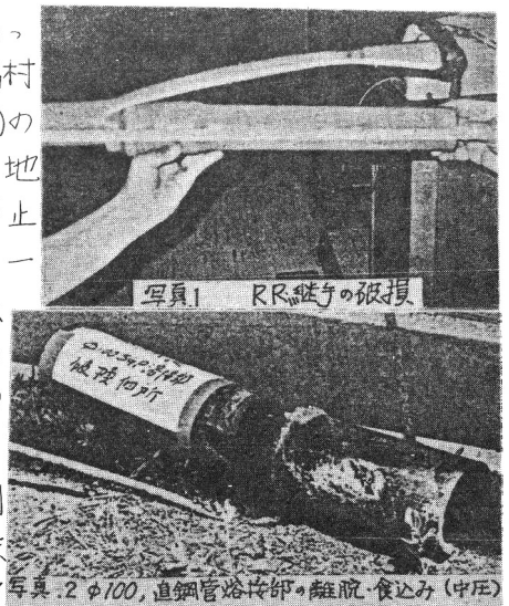
表7 ガス供給停止とガス供給再開