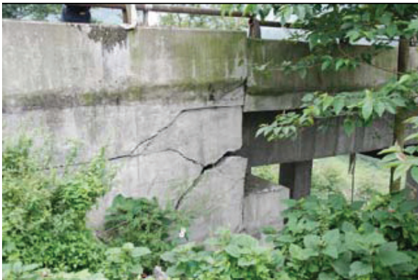
写真-3 主桁の衝突に伴う橋台の被害