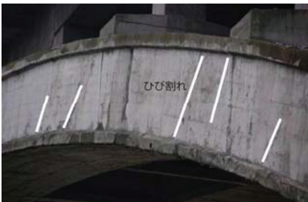
写真-4 アーチクラウン部近くのクラック