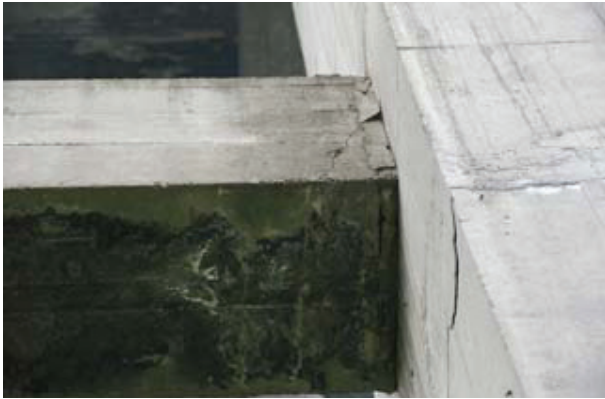
写真-2 鉛直材と横梁との接合部のクラック