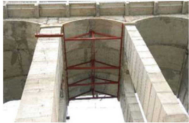
写真-11 アーチクラウン継ぎ目部の破壊