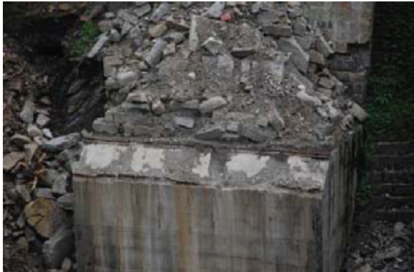
写真-14 アーチ主構の支持部