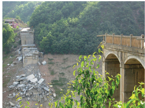
写真-7 本震直後の井田坝大橋