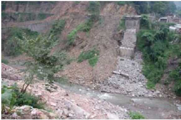
写真-13 倒壊した紅東大橋