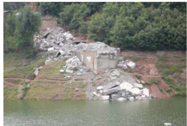
写真-8 左岸側のアーチリブ基部の破壊

などの被害を挙げ、「嚴重損害」と分類されている。なお、補修補強のため、通行止めの措置が取られた。