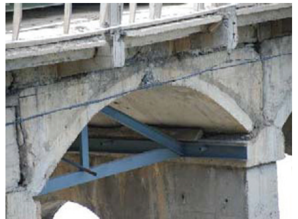
写真-12 アンゲル材でトラスに応急補強された床版損傷部

広域的には青川県と広元市内または甘肅を連結する橋梁である。1995年に着工され、1997年に竣工した。図-6(推定)に示すように、2径間RCアーチ(2×85m、文献16)では2×75m、文献17)では2×70m)であり、幅員は約7m、中間橋脚高さ約50m、橋長約270mである。写真-7、写真-8に示すように、地震によって中間橋脚が基部に近い位置で倒壊し、アーチが完全に崩壊した。信憑性は確認できないが、地震時に中間橋脚が橋軸方向に倒れ、アーチ主構が折れて倒壊したという現場近くの住民の証言がある。アーチ主構と中間橋脚の何れが先に崩壊したかは判断がつかないが、一般にはアーチ主構が先に崩壊したとすれば、中間橋脚が基部に近い位置から倒壊する可能性が低いと考えられることから、中間橋脚が先に崩壊したと見ることが妥当だと考えられる。しかし、アーチ主構は低鉄筋であることから、水平地震力によってアーチ主構に曲げモーメントが発生し、いずれかの側のアーチ主構が先に破壊し、この結果、もう一方のアーチ主構の水平力によって中間橋脚が倒れ、橋梁全体の崩壊につながったとの考え方 16) も否定できない。また、文献17)では、断層の付近に位置している点が崩壊の原因だと分析されている。ただし、地盤条件など、他の複合的な要因についても検討する必要がある。たとえば、破壊したコンクリートブロックには大きな玉石が骨材として使用されており、建設時の品質管理の問題が挙げられる。また、基準に従って設計されていなかったことも考えられる。