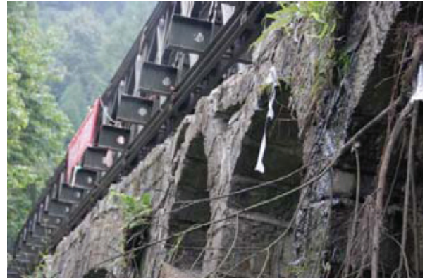
写真-16 アーチクラウン部と1/4との中間部に生じた損傷