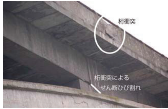
写真-5 アーチクラウン部の桁間衝突