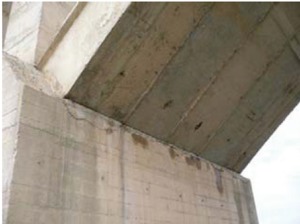
写真-10 アーチリブの付け根のひび割れ